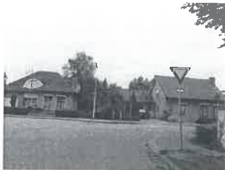
Foto 6 voorrang geregeld in 30 km/uur